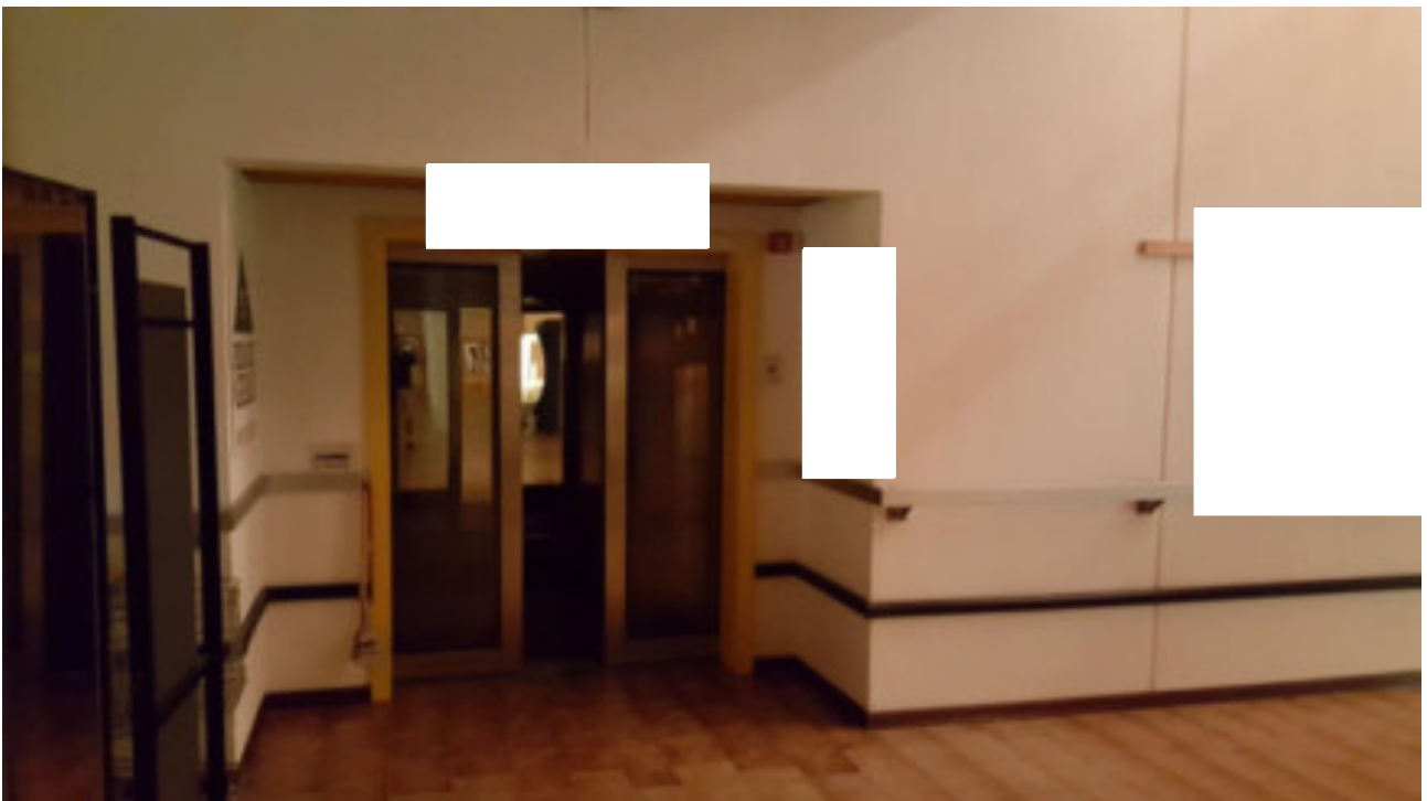
L'ASCENSORE PRESSO ex SUPERMERCATO LOTTO 001