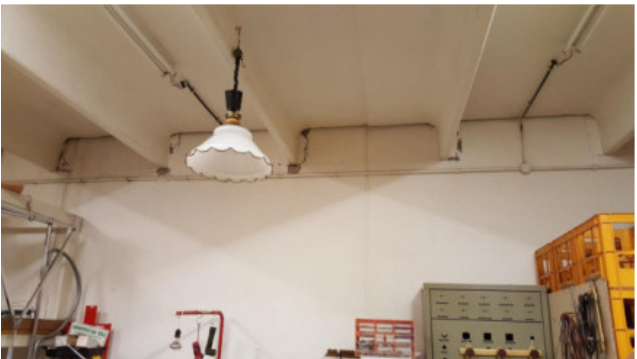
INTERNO LOTTO 002 si notano le fessurazioni presso la muratura su appoggi o del solaio