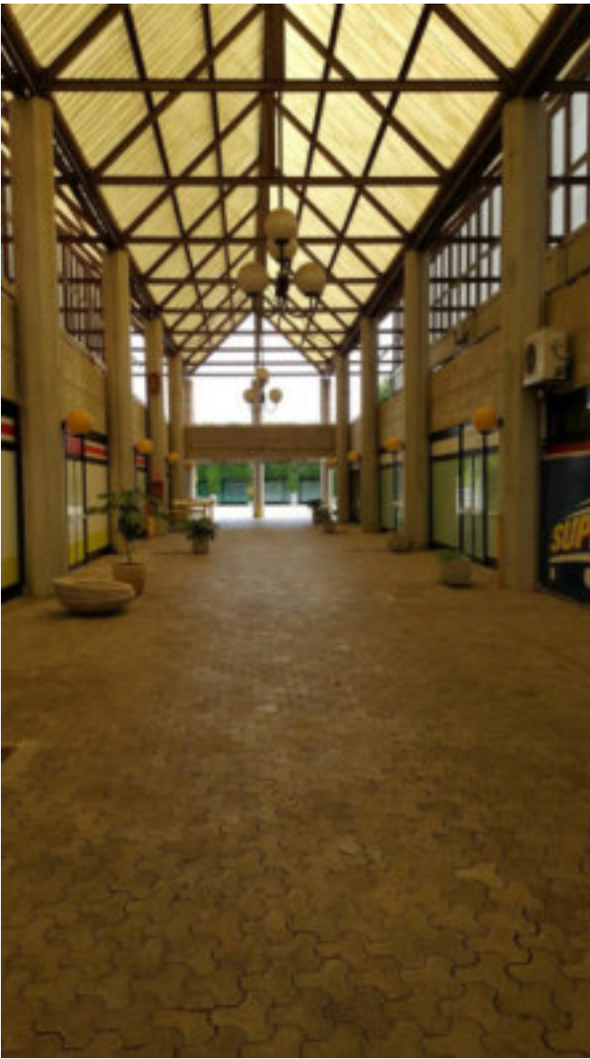
IL CORRIDOIO o GALLERIA