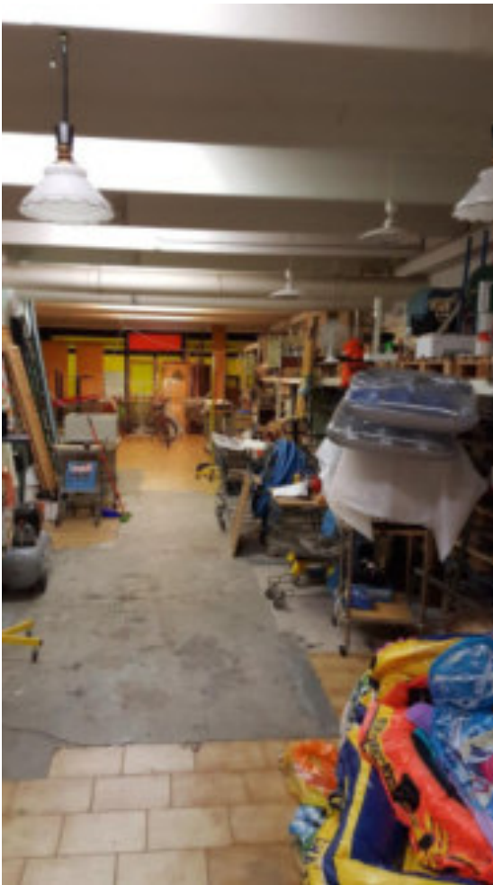
L'INTERNO DEL LOTTO 002 si notano le tubazioni di aspirazione correnti a soffitto