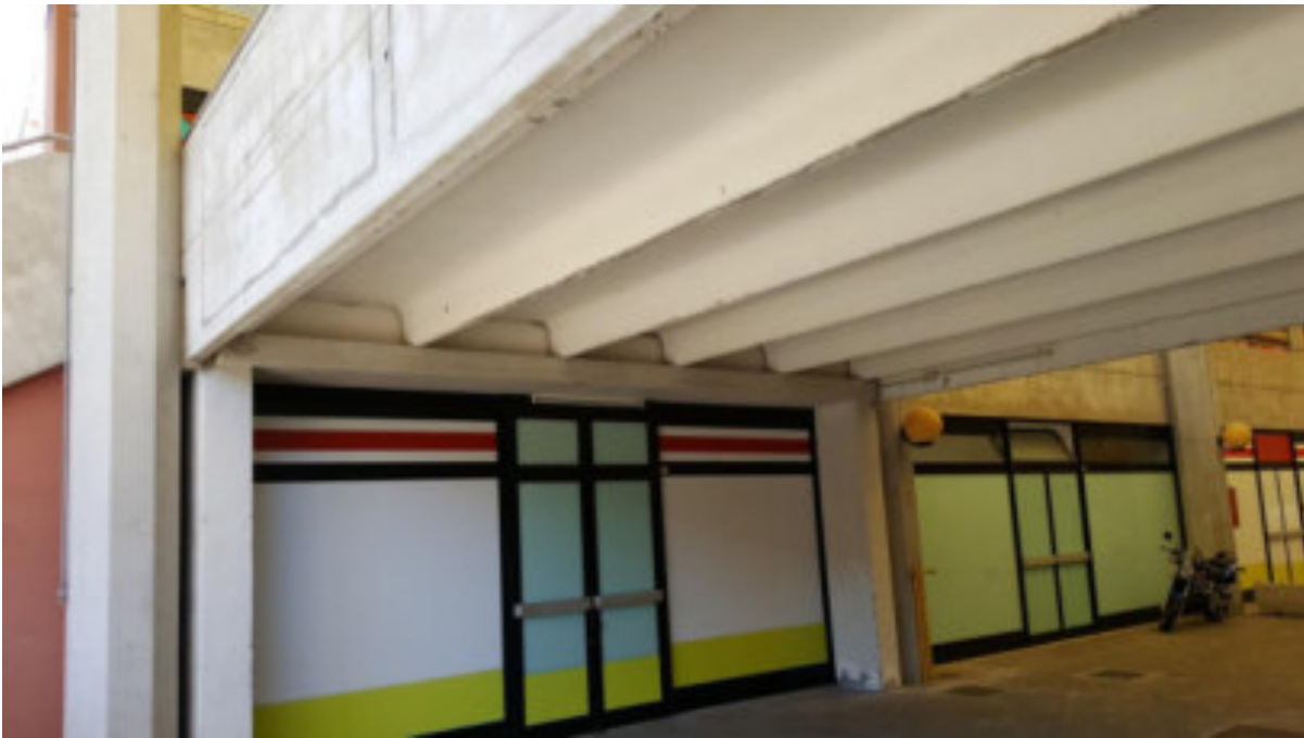
PROSPETTO TIPO VETRATE IN ESPOSIZIONE SU CORRIDOIO o GALLERIA