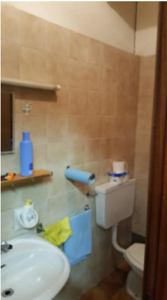
TIPOLOGIA DEL SERVIZIO LOTTO 002