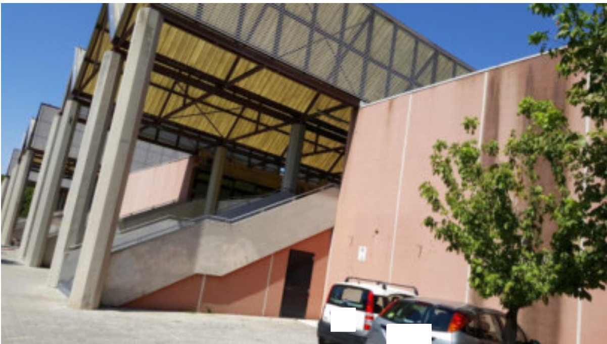
VISTA PROSPETTO SUD-OVEST