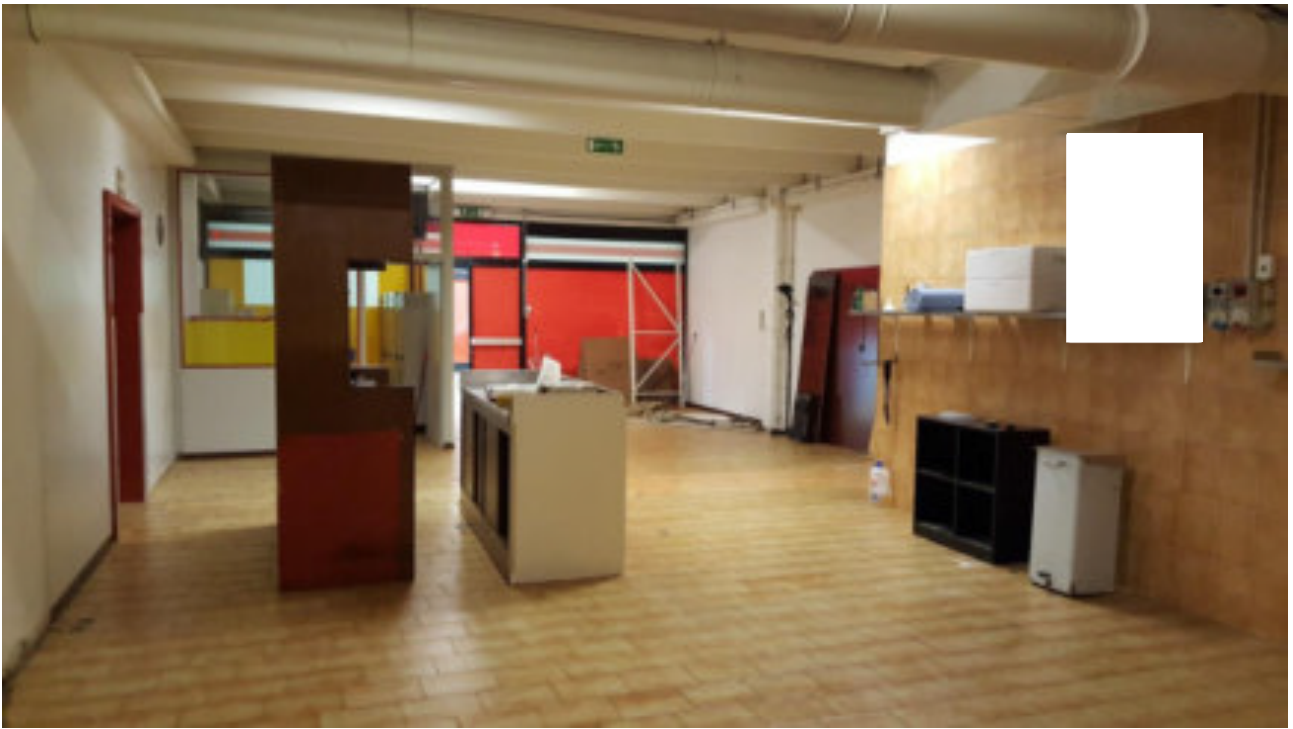
IL RETRO BOTTEGA DEL LOTTO 001