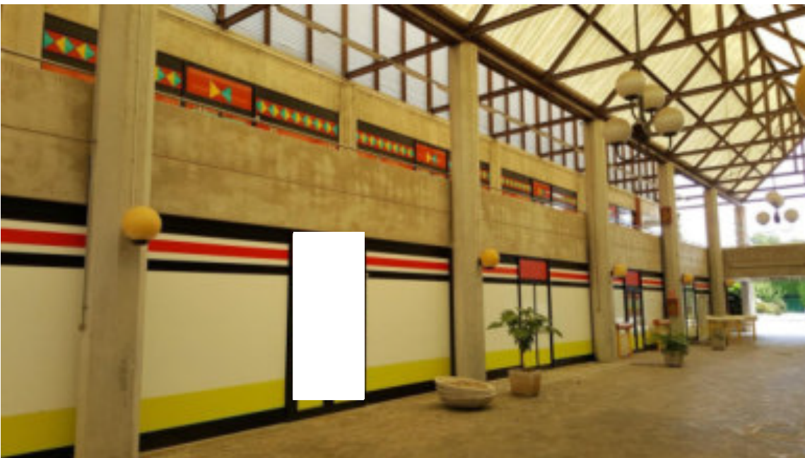
PROSPETTO TIPO VETRATE IN ESPOSIZIONE SU CORRIDOIO o GALLERIA