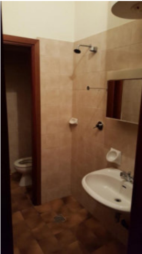
TIPOLOGIA DEL BAGNO SU RETRO BOTTEG