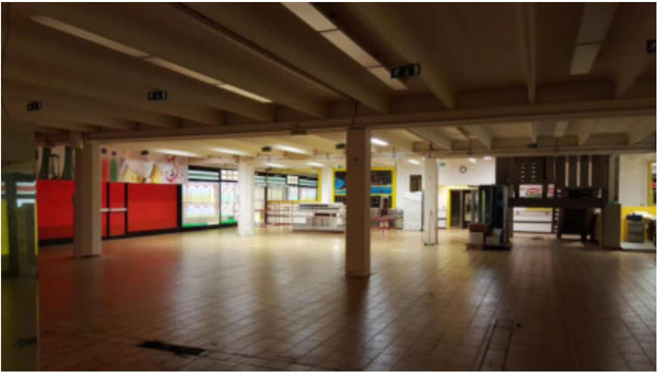
IL NEGOZIO EX SUPERMERCATO LOTTO 001