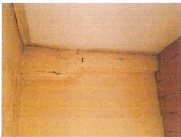
16. Vista locale a piano primo. Particolare della trave fuori spessore.