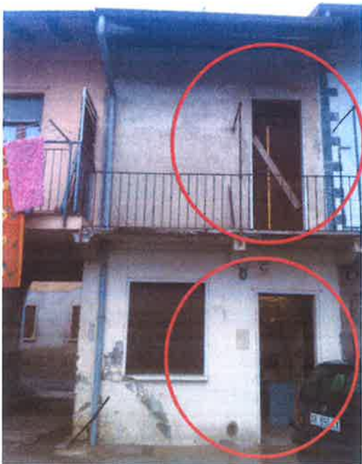
4. Vista dell'unità in oggetto dal cortile comune. Sono visibili ed evidenziati gli ingressi ai locali sovrapposti.