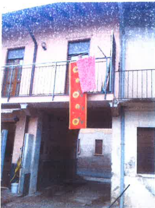
3. Vista dell'ingresso al cortile comune dall'interno.