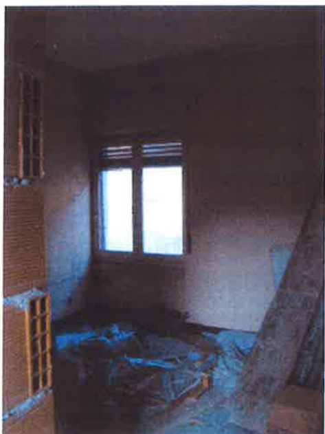
15. Vista interna locale a piano primo.