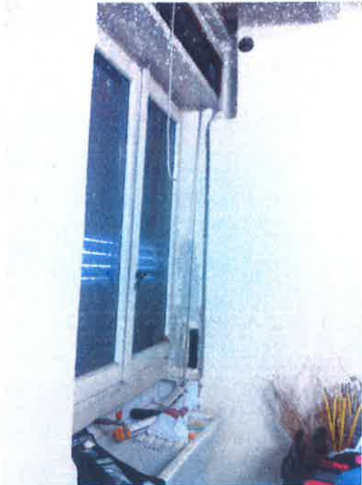
13. Vista interna del locale a piano terra. Particolare della finestra.