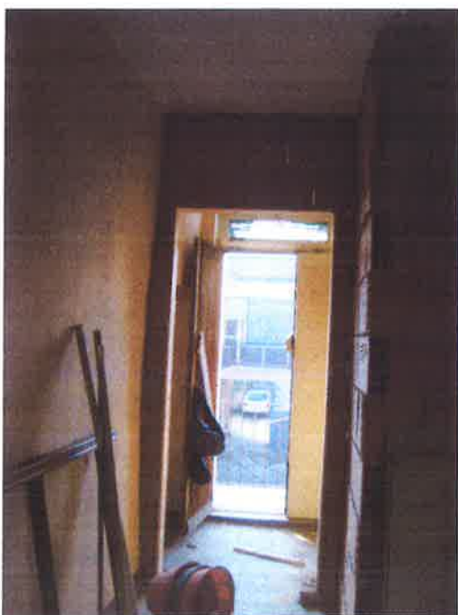
17. Vista del locale a piano primo. Particolare dell'ingresso verso il ballatoio esterno.