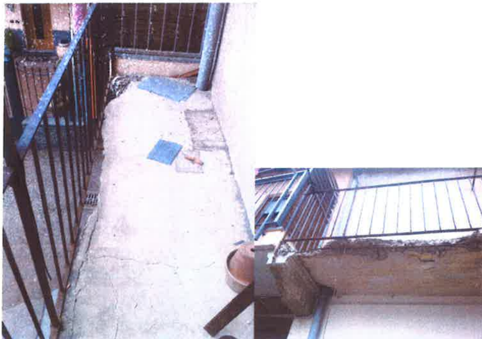
11. Vista del ballatoio di accesso al locale posto al primo piano. Si sottolinea lo stato di avanzato degrado in cui si trova.