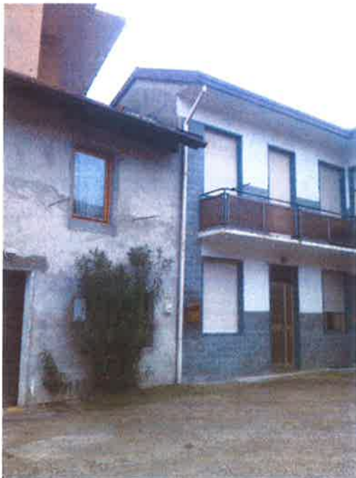
8. Vista dal cortile del contesto limitrofo.