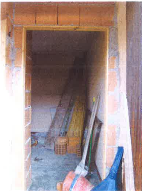
14. Vista interna locale a piano primo.