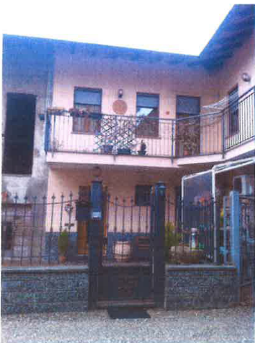
6. Vista dal cortile del contesto limitrofo.