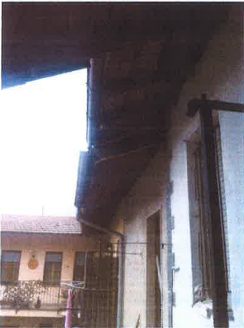
10. Vista della porzione di copertura sovrastante l'ingresso del locale al primo piano. Si sottolinea lo stato di avanzato degrado in cui si trova.