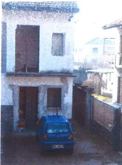
7. Vista dal cortile del contesto limitrofo. Particolare dell'unità abitativa in corso di ristrutturazione ma apparentemente lasciata incompiuta da tempo.