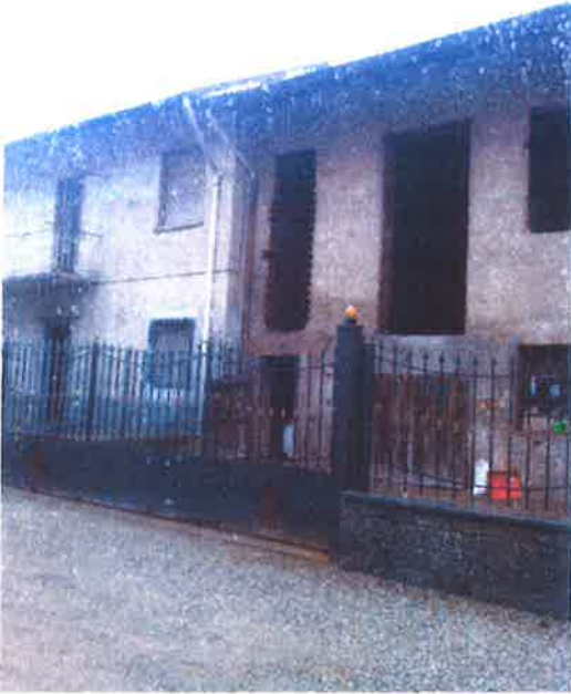
9. Vista dal cortile del contesto limitrofo.