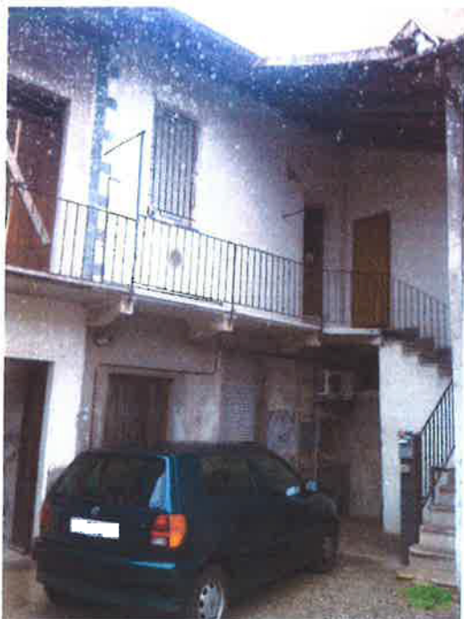
5. Vista dal cortile comune della scala esterna che collega i locali sovrapposti dell'unità in oggetto.