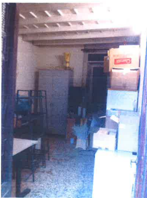
12. Vista interna del locale a piano terra.