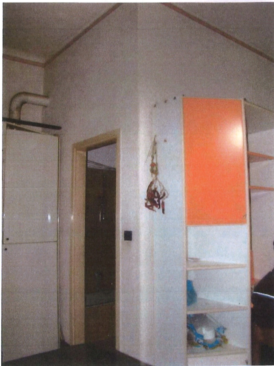
Fotografia n. 20 – Via Padova n. 151 Milano: vista della porta di ingresso al locale bagno

MARIANGELA SIRENA Architetto - 20146 Milano - Via Arzaga, 15 Tel. 02 4120786 - fax 02 39543015 - cell. 335 5470992 e-mail: mariangela.sirena@pct.pecopen.it - arch.mariangelasirena@lamiapcc.it website: www.studiosirena.it