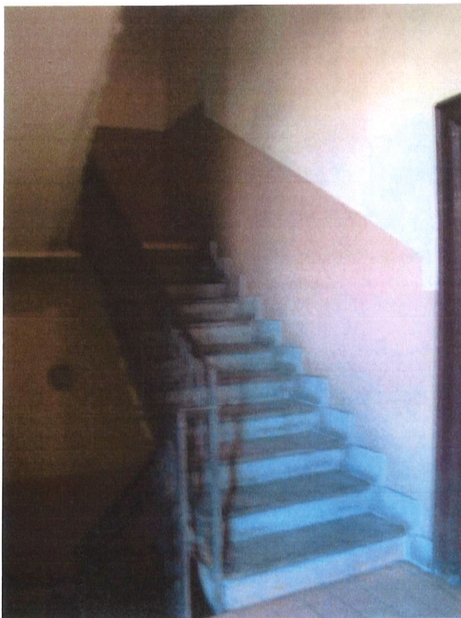
Fotografia n. 11 – Via Padova n. 151 Milano: vista del vano scale condominiale

MARIANGELA SIRENA Architetto - 20146 Milano - Via Arzaga, 15 Tel. 02 4120786 - fax 02 39543015 - cell. 335 5470992 e-mail: mariangela.sirena@pct.pecopen.it - arch.mariangelasirena@lamiapec.it website: www.studiosirena.it