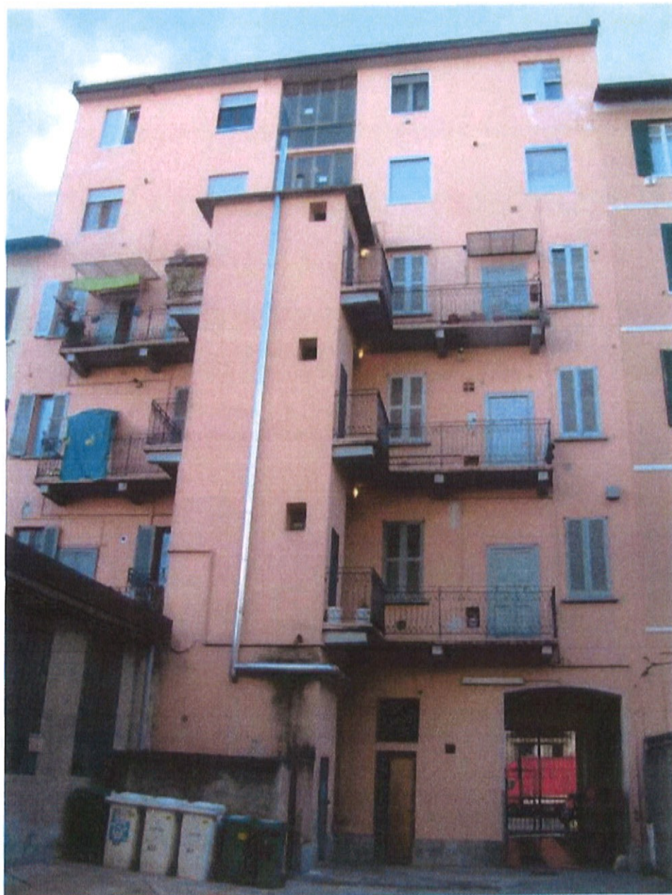
Fotografia n. 8 – Via Padova n. 151 Milano: facciata interna lato cortile

MARIANGELA SIRENA Architetto - 20146 Milano - Via Arzaga, 15 Tel. 02 4120786 - fax 02 39543015 - cell. 335 5470992 e-mail: mariangela.sirena@pct.pecopen.it - arch.mariangelasirena@lamiapcc.it website: www.studiosirena.it