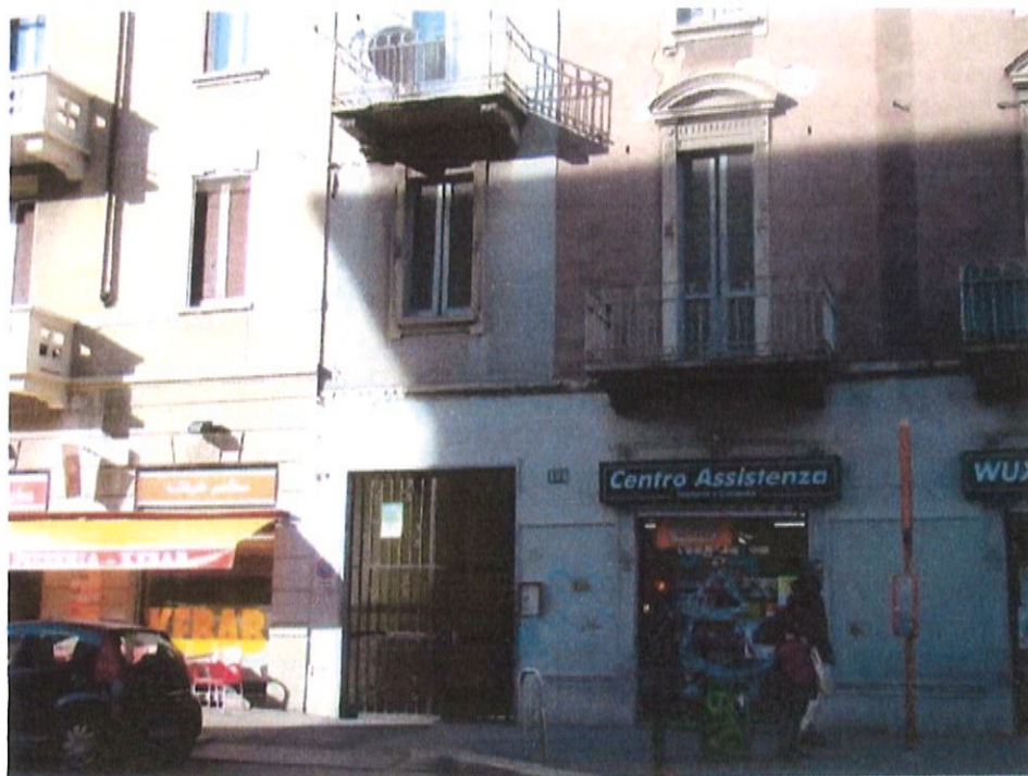
Fotografia n. 2 – Via Padova n. 151 Milano: particolare delle attività commerciali e del portone di ingresso al piano terra sulla facciata principale fronte strada

MARIANGELA SIRENA Architetto - 20146 Milano - Via Arzaga, 15 Tel. 02 4120786 - fax 02 39543015 - cell. 335 5470992 e-mail: mariangela.sirena@pct.pecopen.it - arch.mariangelasirena@lamiapec.it website: www.studiosirena.it