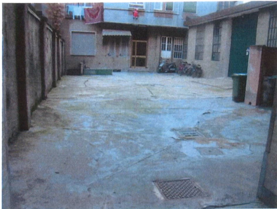
Fotografia n. 9 – Via Padova n. 151 Milano: particolare della pavimentazione del cortile interno

MARIANGELA SIRENA Architetto - 20146 Milano - Via Arzaga, 15 Tel. 02 4120786 - fax 02 39543015 - cell. 335 5470992 e-mail: mariangela.sirena@pct.pecopen.it - arch.mariangelasirena@lamiapcc.it website: www.studiosirena.it