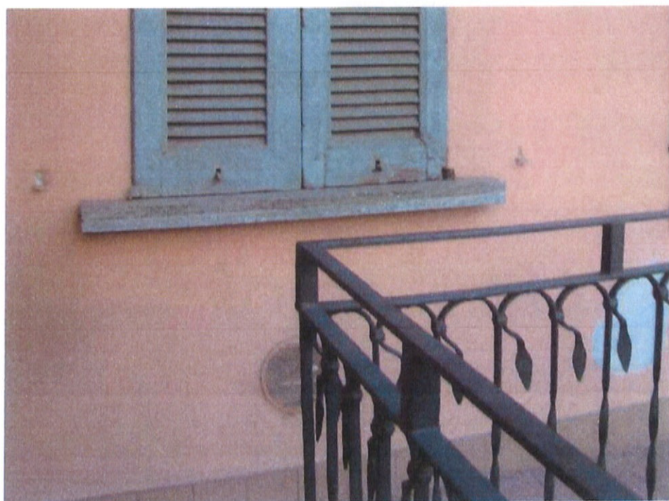
Fotografia n. 13 – Via Padova n. 151 Milano: particolare di uno dei serramenti dell'appartamento oggetto di esecuzione