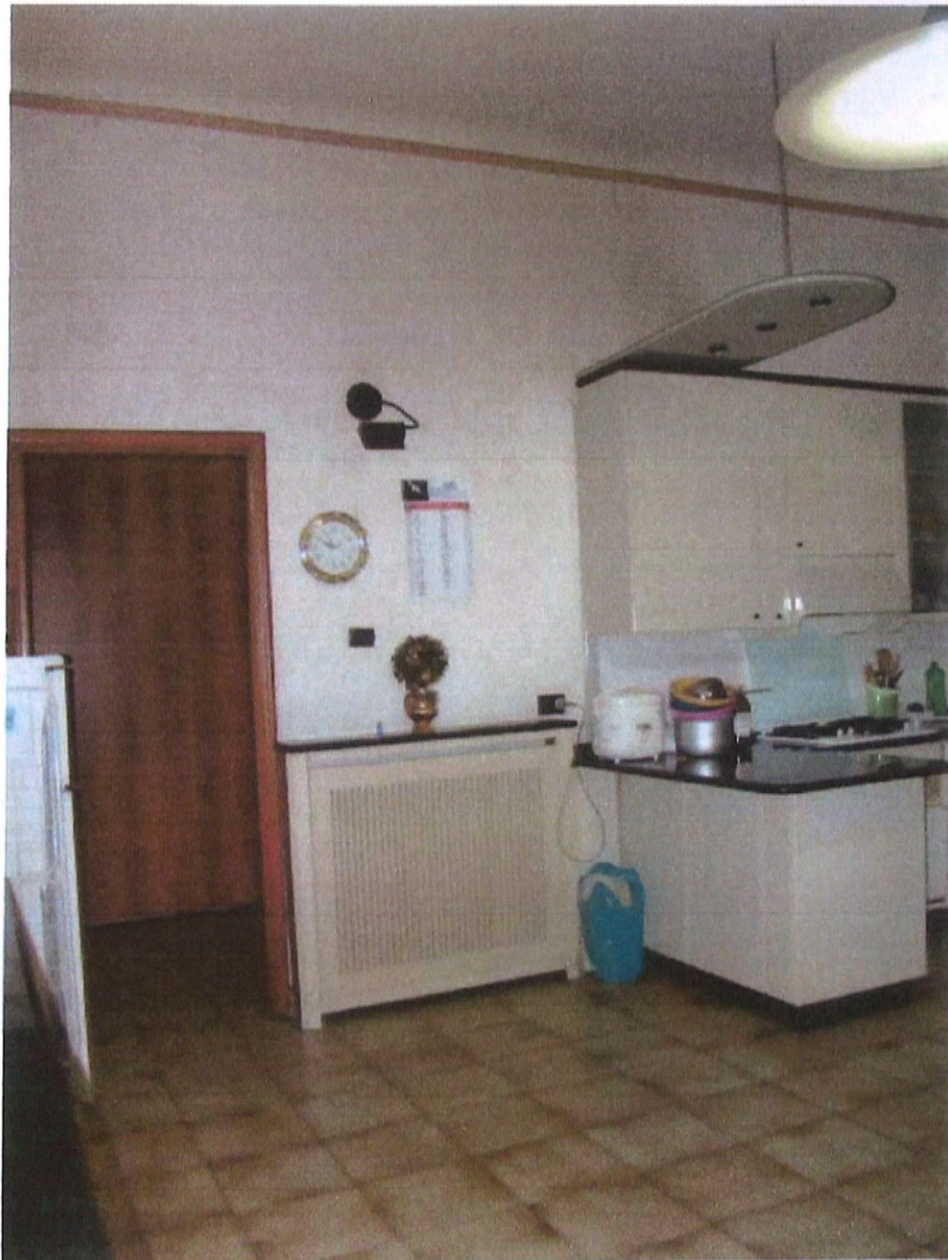
Fotografia n. 17 – Via Padova n. 151 Milano: loCALE soggiorno/pranzo/angolo cottura