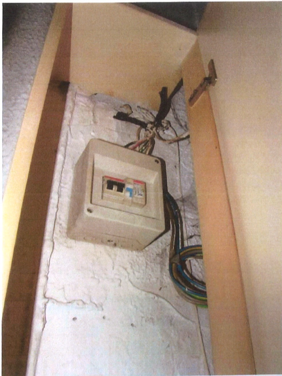
Fotografia n. 16 – Via Padova n. 151 Milano: particolare del quadro elettrico non a norma, posizionato in prossimità dell'ingresso

MARIANGELA SIRENA Architetto - 20146 Milano - Via Arzaga, 15 Tel. 02 4120786 - fax 02 39543015 - cell. 335 5470992 e-mail: mariangela.sirena@pct.pecopen.it - arch.mariangelasirena@lamiapcc.it website: www.studiosirena.it