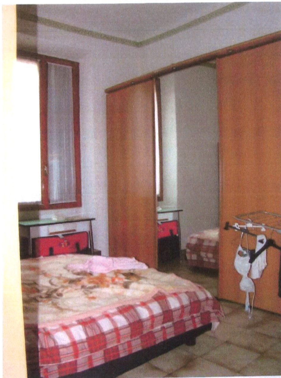
Fotografia n. 23 – Via Padova n. 151 Milano: seconda camera da letto

MARIANGELA SIRENA Architetto - 20146 Milano - Via Arzaga, 15 Tel. 02 4120786 - fax 02 39543015 - cell. 335 5470992 e-mail: mariangela.sirena@pct.pecopen.it - arch.mariangelasirena@lamiapcc.it website: www.studiosirena.it