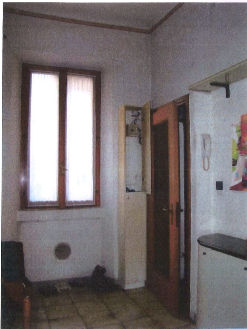
Fotografia n. 15 – Via Padova n. 151 Milano: vista dell'ingresso all'appartamento

MARIANGELA SIRENA Architetto - 20146 Milano - Via Arzaga, 15 Tel. 02 4120786 - fax 02 39543015 - cell. 335 5470992 e-mail: mariangela.sirena@pct.pecopen.it - arch.mariangelasirena@lamiapcc.it website: www.studiosirena.it