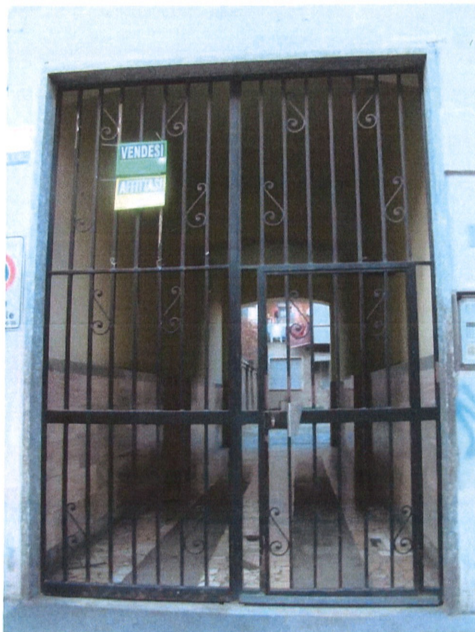
Fotografia n. 4 – Via Padova n. 151 Milano: particolare del portone di ingresso

MARIANGELA SIRENA Architetto - 20146 Milano - Via Arzaga, 15 Tel. 02 4120786 - fax 02 39543015 - cell. 335 5470992 e-mail: mariangela.sirena@pct.pecopen.it - arch.mariangelasirena@lamiapcc.it website: www.studiosirena.it