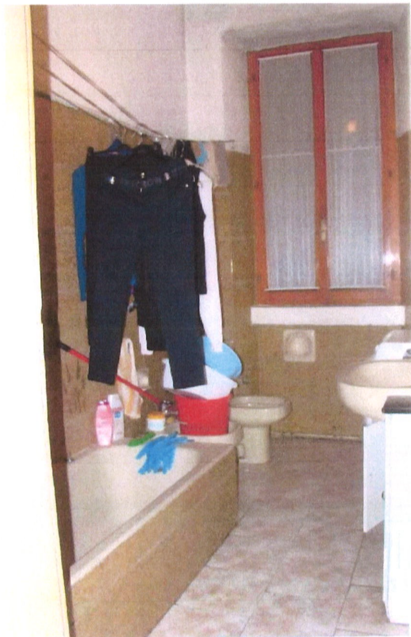
Fotografia n. 21 – Via Padova n. 151 Milano: locale bagno, privo di antibagno