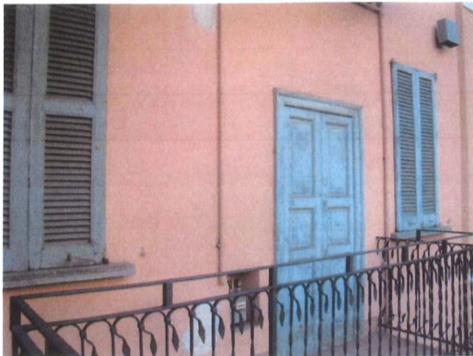
Fotografia n. 12 – Via Padova n. 151 Milano: particolare del ballatoio