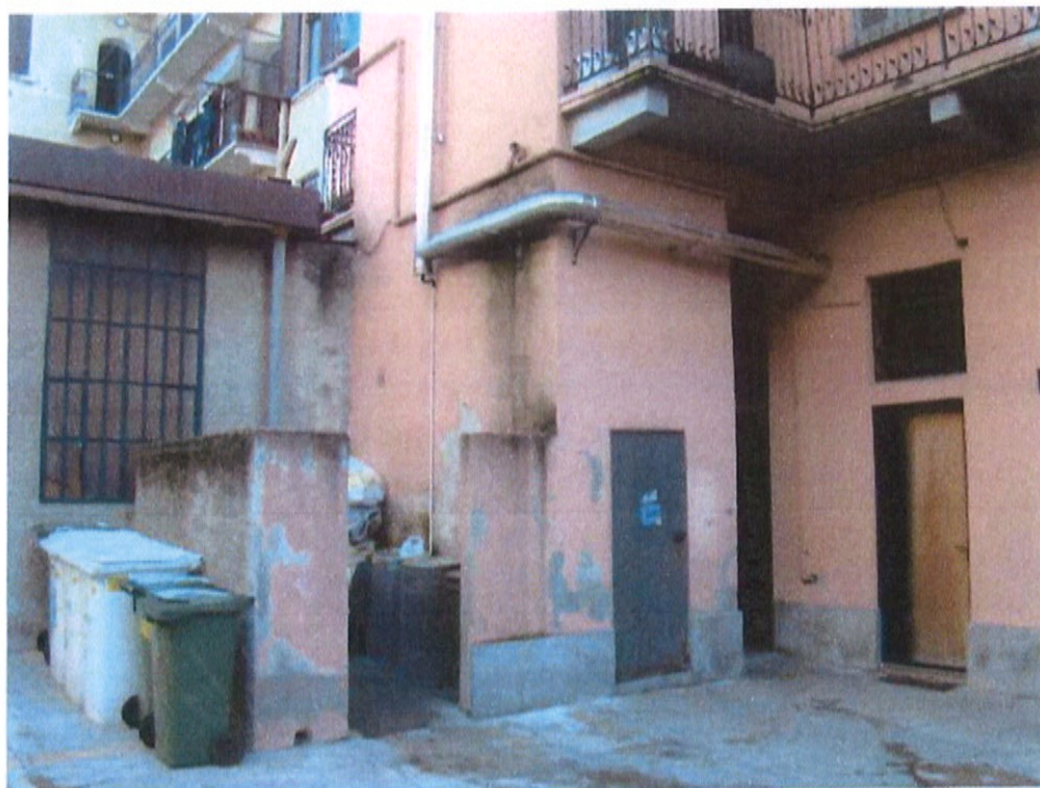
Fotografia n. 10 – Via Padova n. 151 Milano: particolare dell'area predisposta per l'alloggiamento della raccolta differenziata dei rifiuti