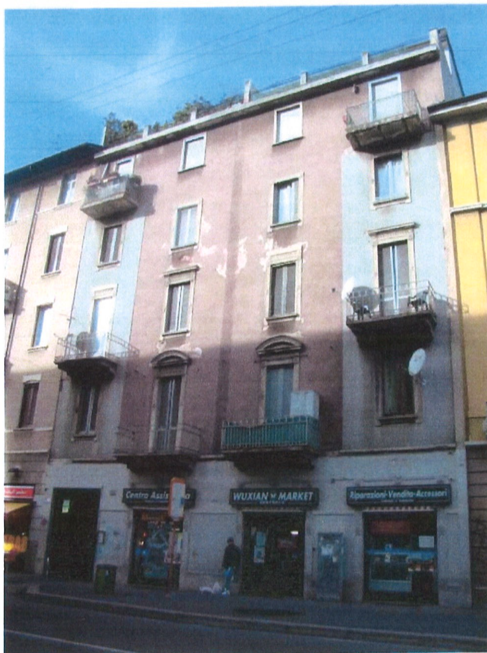
Fotografia n. 1 – Via Padova n. 151 Milano: facciata principale fronte strada