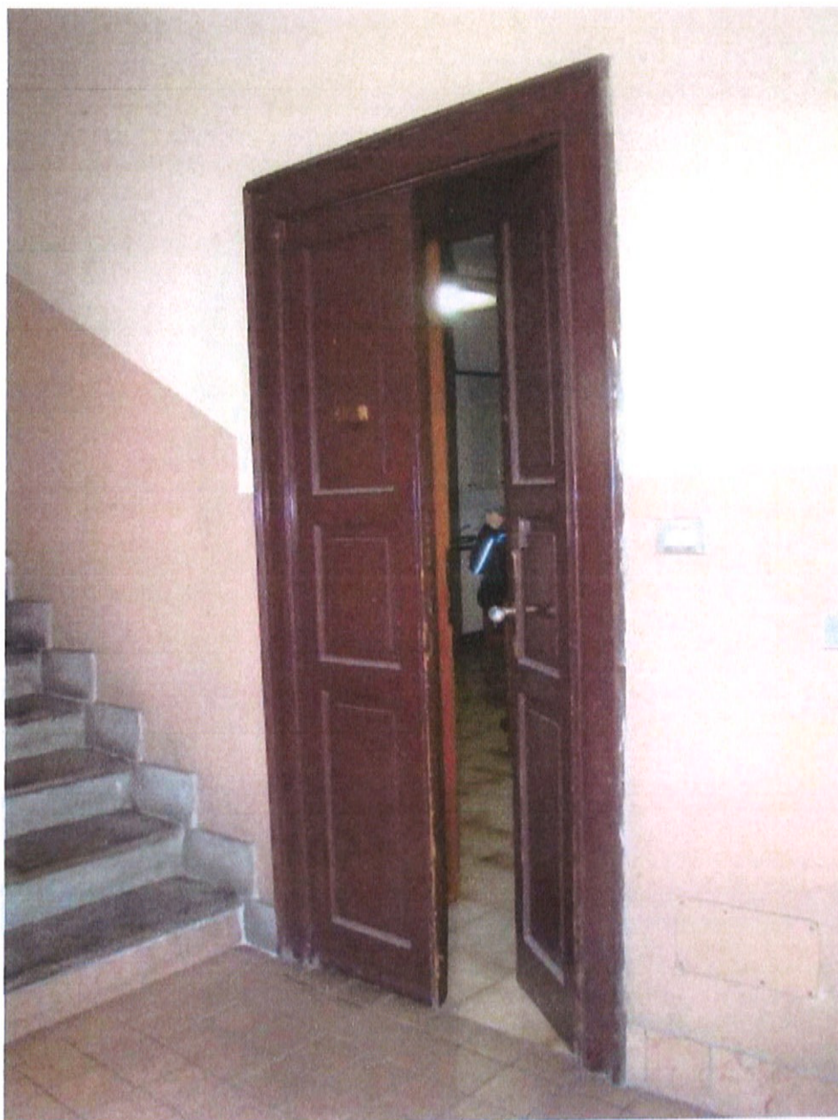
Fotografia n. 14 – Via Padova n. 151 Milano: porta di ingresso all'appartamento dei debitori esecutati, al piano primo