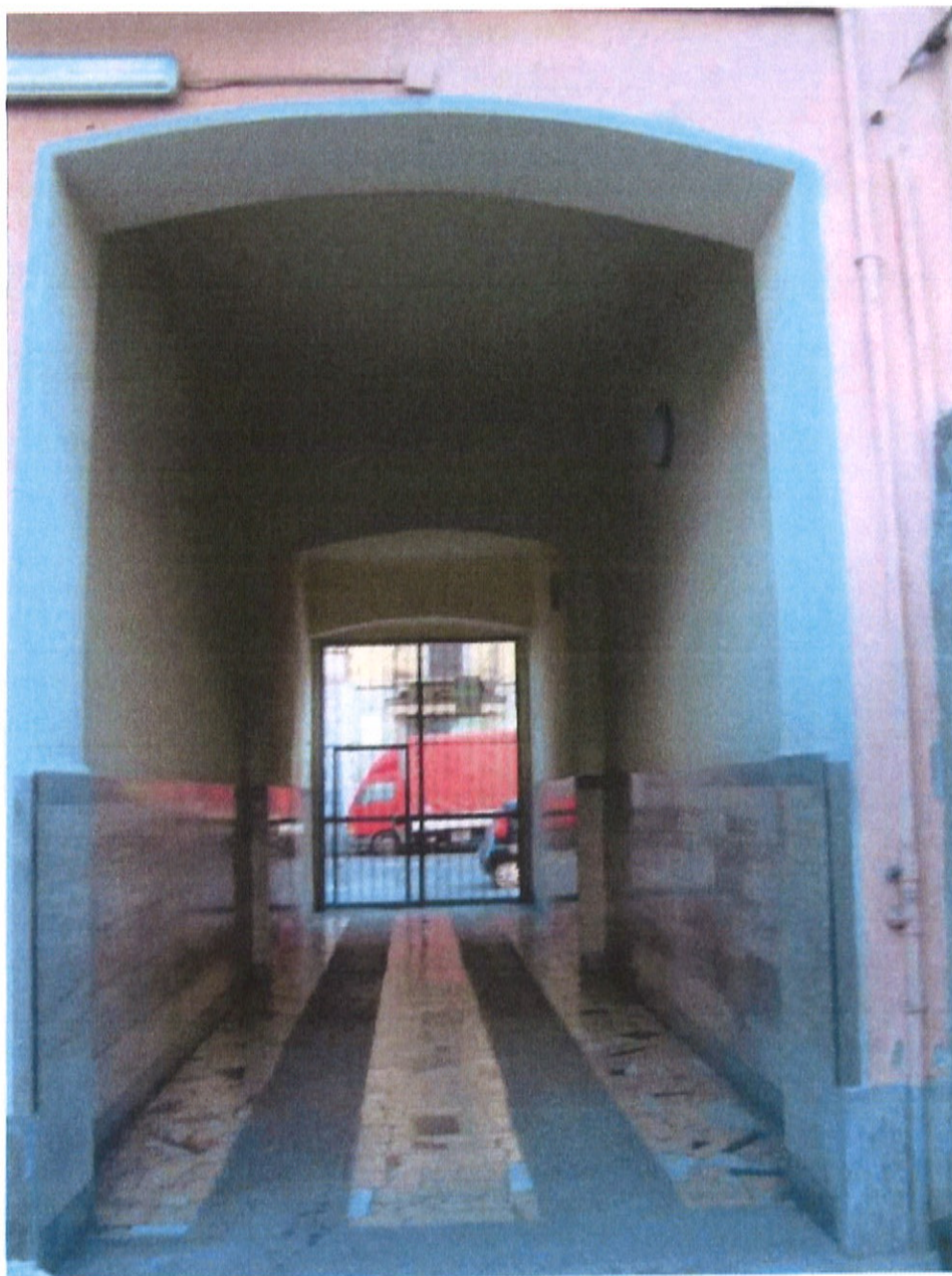
Fotografia n. 7 – Via Padova n. 151 Milano: vista del passaggio carraio verso il portone di ingresso