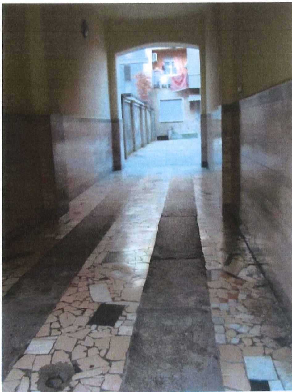
Fotografia n. 6 – Via Padova n. 151 Milano: vista del passaggio carraio verso il cortile interno