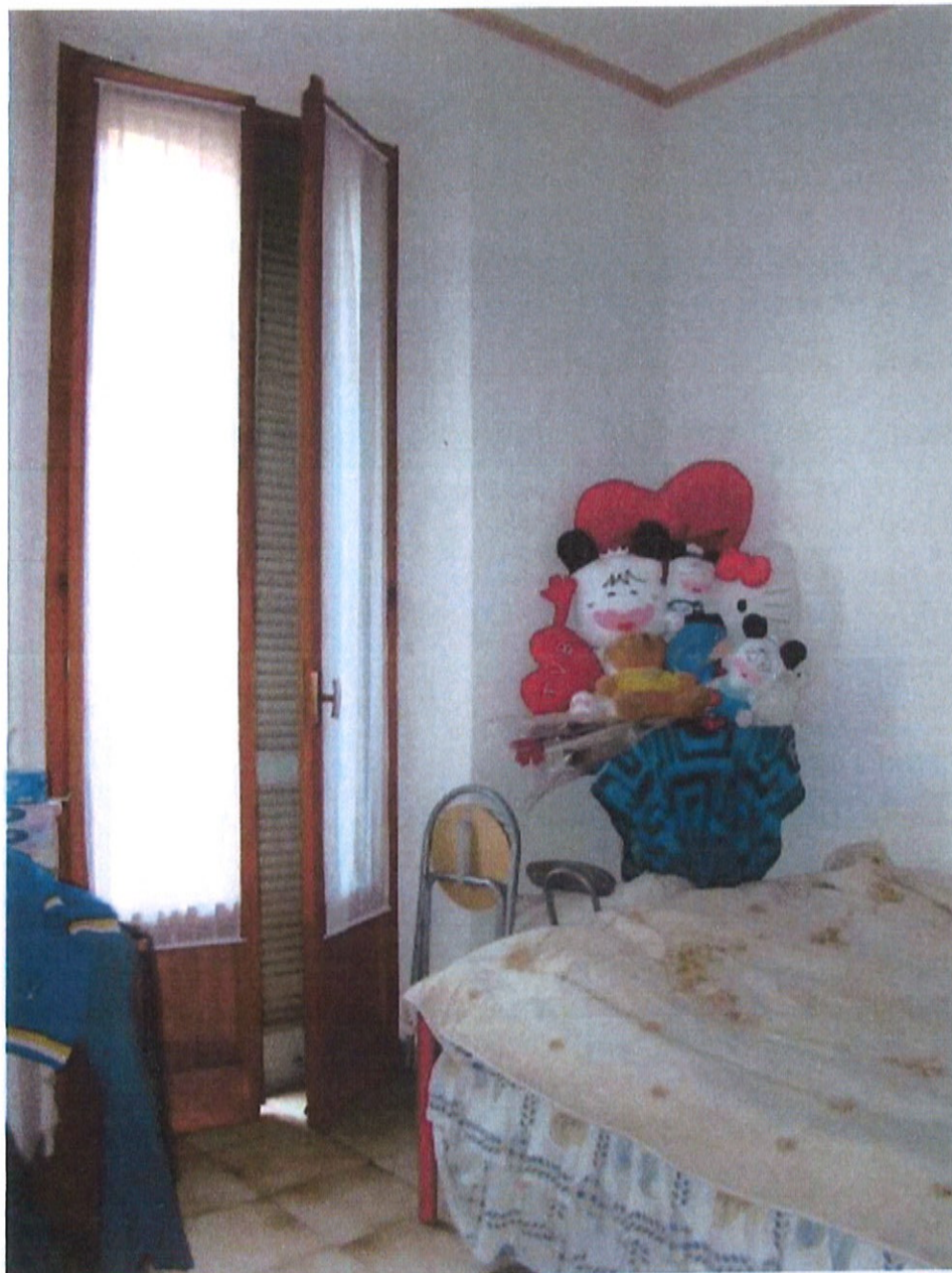
Fotografia n. 22 – Via Padova n. 151 Milano: prima camera da letto