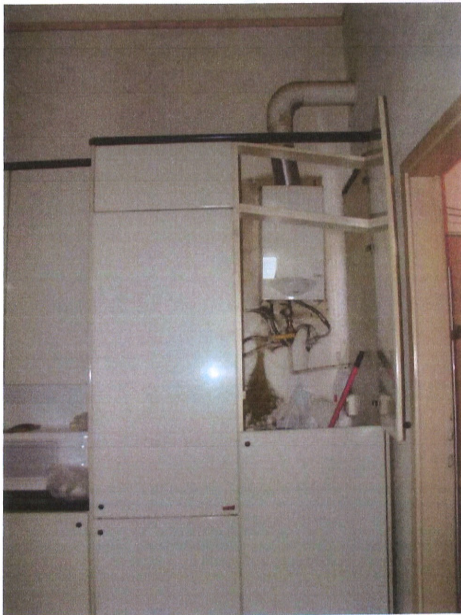
Fotografia n. 19 – Via Padova n. 151 Milano: particolare dello scaldabagno, posizionato all'interno di un pensile della cucina

MARIANGELA SIRENA Architetto - 20146 Milano - Via Arzaga, 15 Tel. 02 4120786 - fax 02 39543015 - cell. 335 5470992 e-mail: mariangela.sirena@pct.pecopen.it - arch.mariangelasirena@lamiapcc.it website: www.studiosirena.it