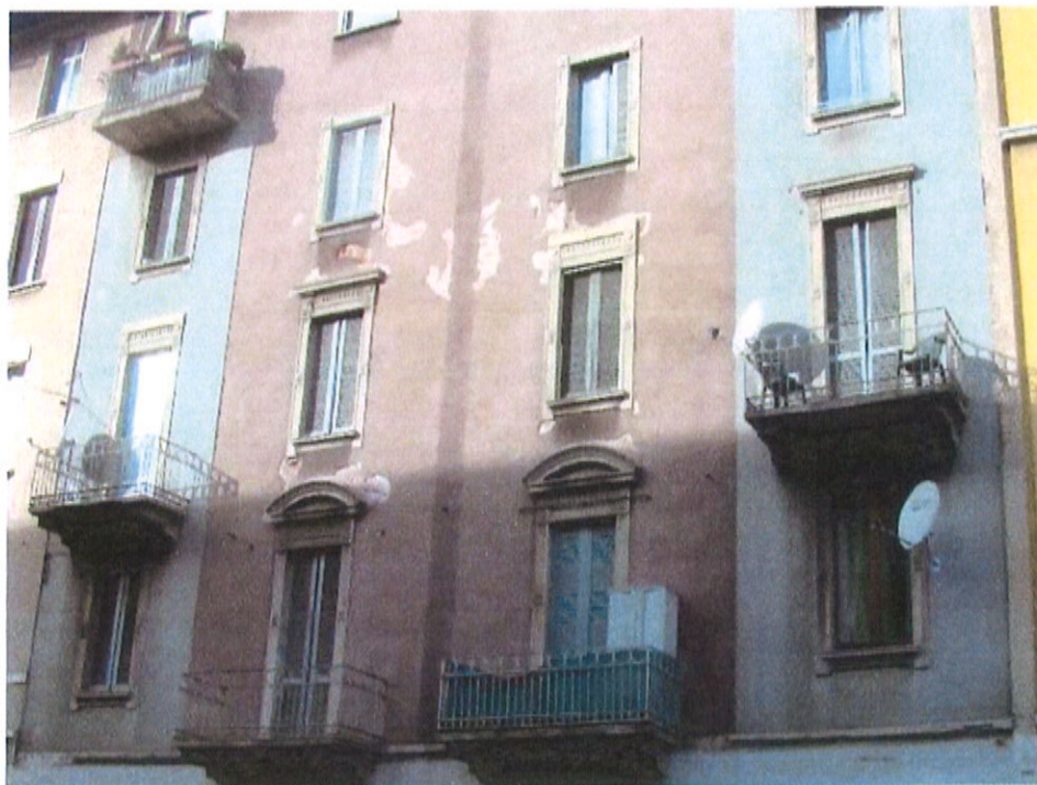
Fotografia n. 3 – Via Padova n. 151 Milano: particolare dei piani superiori adibiti ad abitazione sulla facciata principale fronte strada