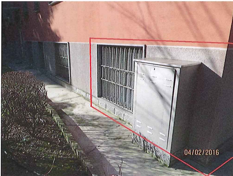
Foto 4 – Inquadratura frontale, da Via Privata Gianferrari dell'unità immobiliare periziata

Via Zurigo 14, 2014 Milano Ordine Architetti Milano n: 4604 Albo CTU Tribunale Milano n° 11428 architetto@colmano.com