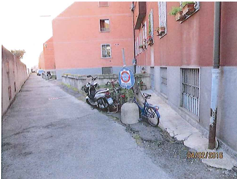
Foto 18 - Vista del corsello di accesso agli spazi laboratorio posti nei seminterrati dei fabbricati