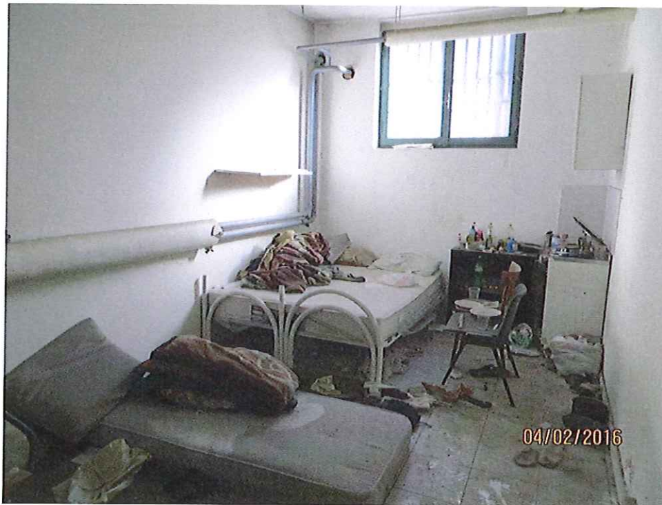
Foto 16 - Vista del locale 3 con affaccio su Via privata Gianferrari