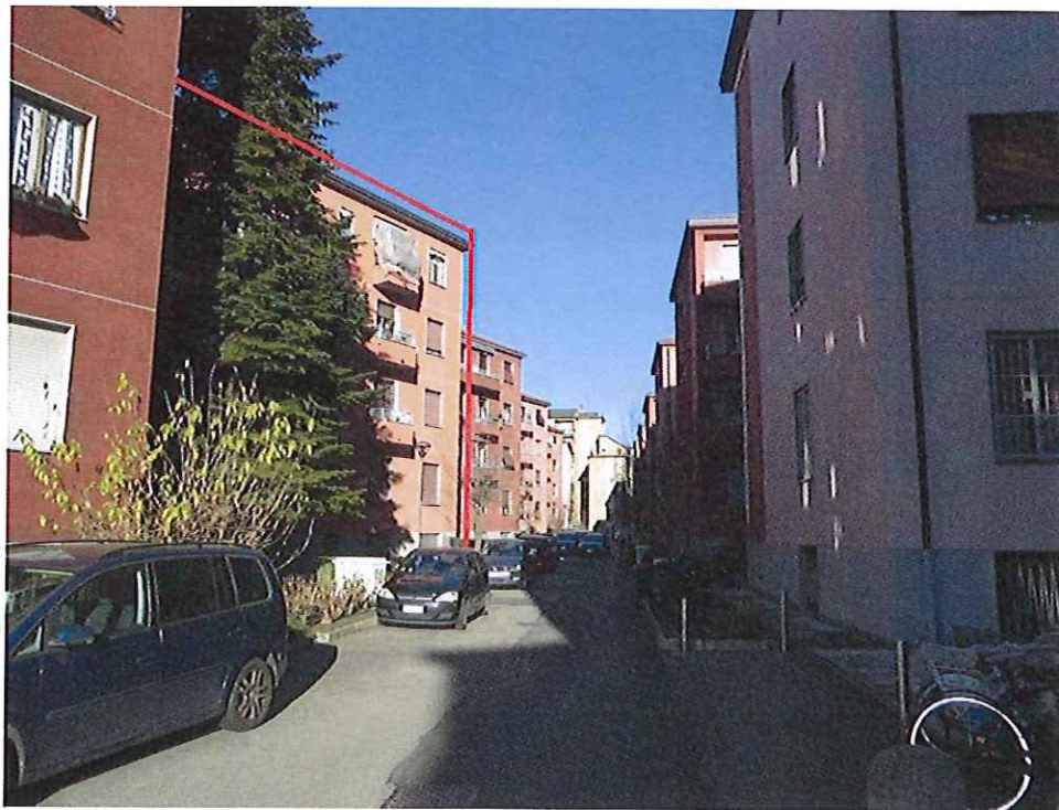
Foto 2 - Vista e inquadramento dello stabile in cui è ubicato l'unità immobiliare periziata