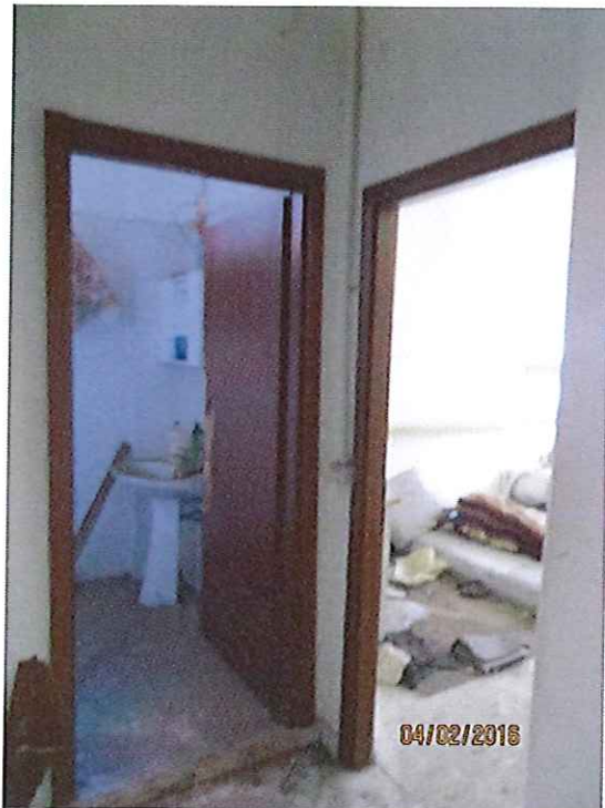
Foto 14 - Vista dal corridoio verso il locale igienico ed il locale 3