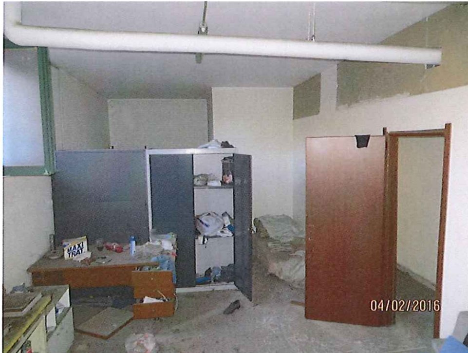
Foto 13 - Vista del locale 2 con affaccio sul retro