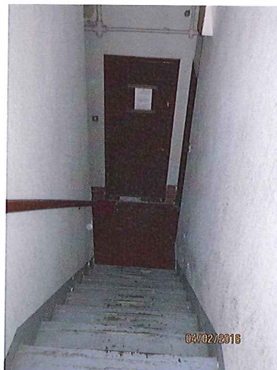
Foto 7 - Vano scala comune per accedere al piano seminterrato in cui è situata l'unità immobiliare periziata