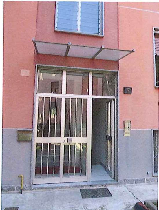
Foto 6 - Ingresso alla palazzina in cui è situata l'unità immobiliare periziata