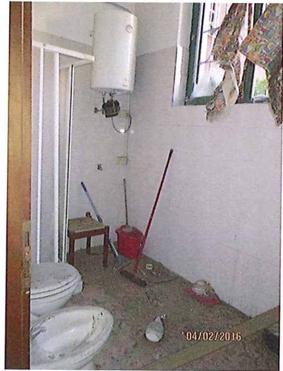
Foto 15 - Locale igienico