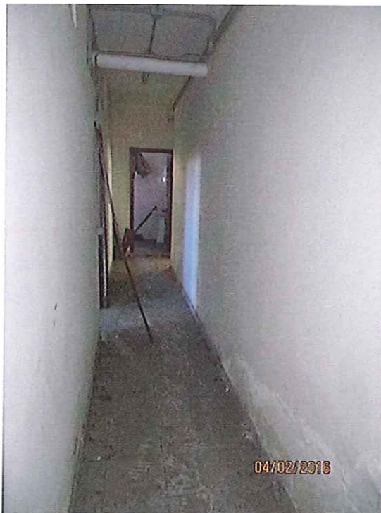
Foto 11 - Vista del corridoio