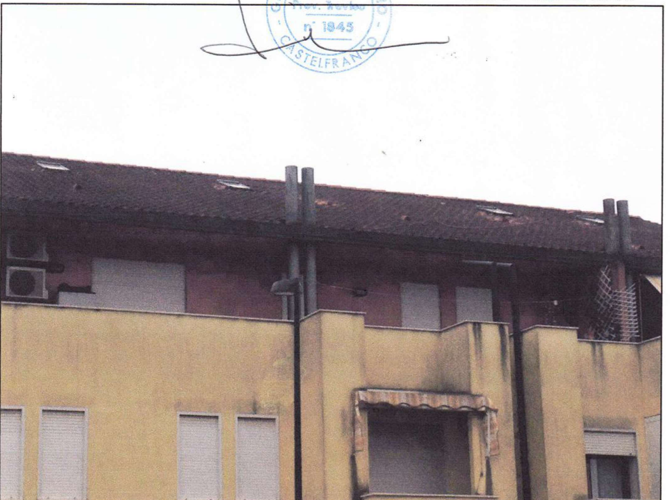
CONO VISUALE N. 02