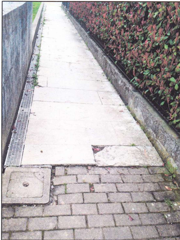
CONO VISUALE N. 05