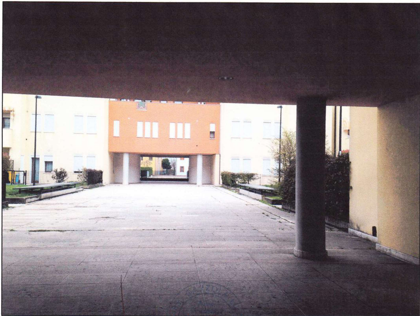
CONO VISUALE N. 03