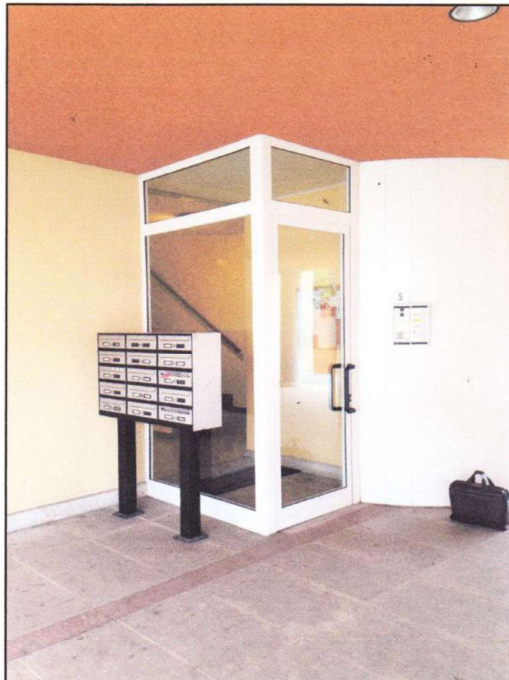
CONO VISUALE N. 06