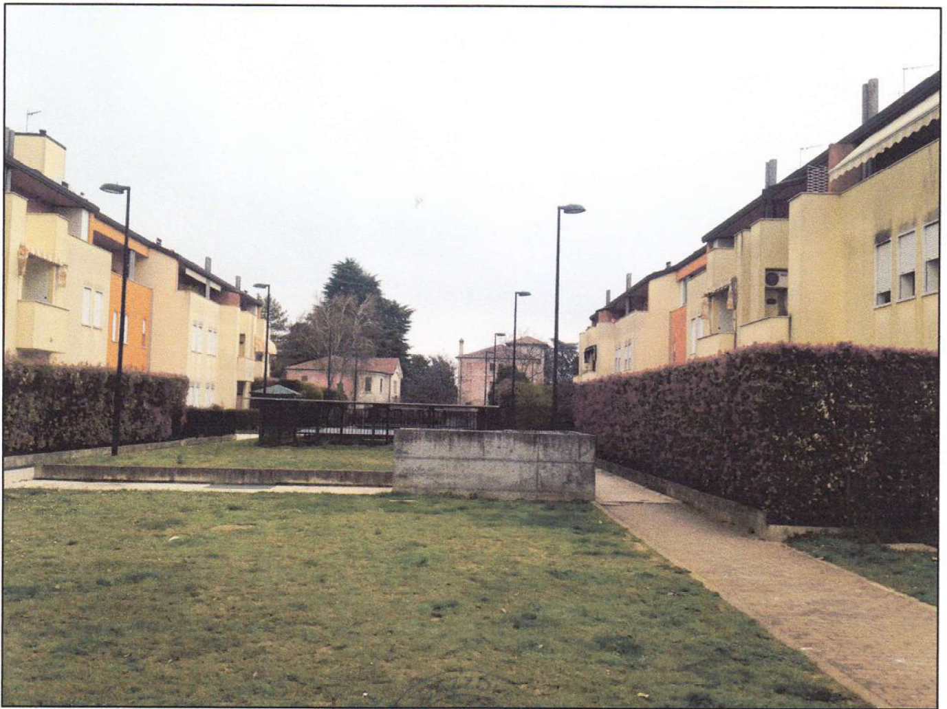
CONO VISUALE N. 01