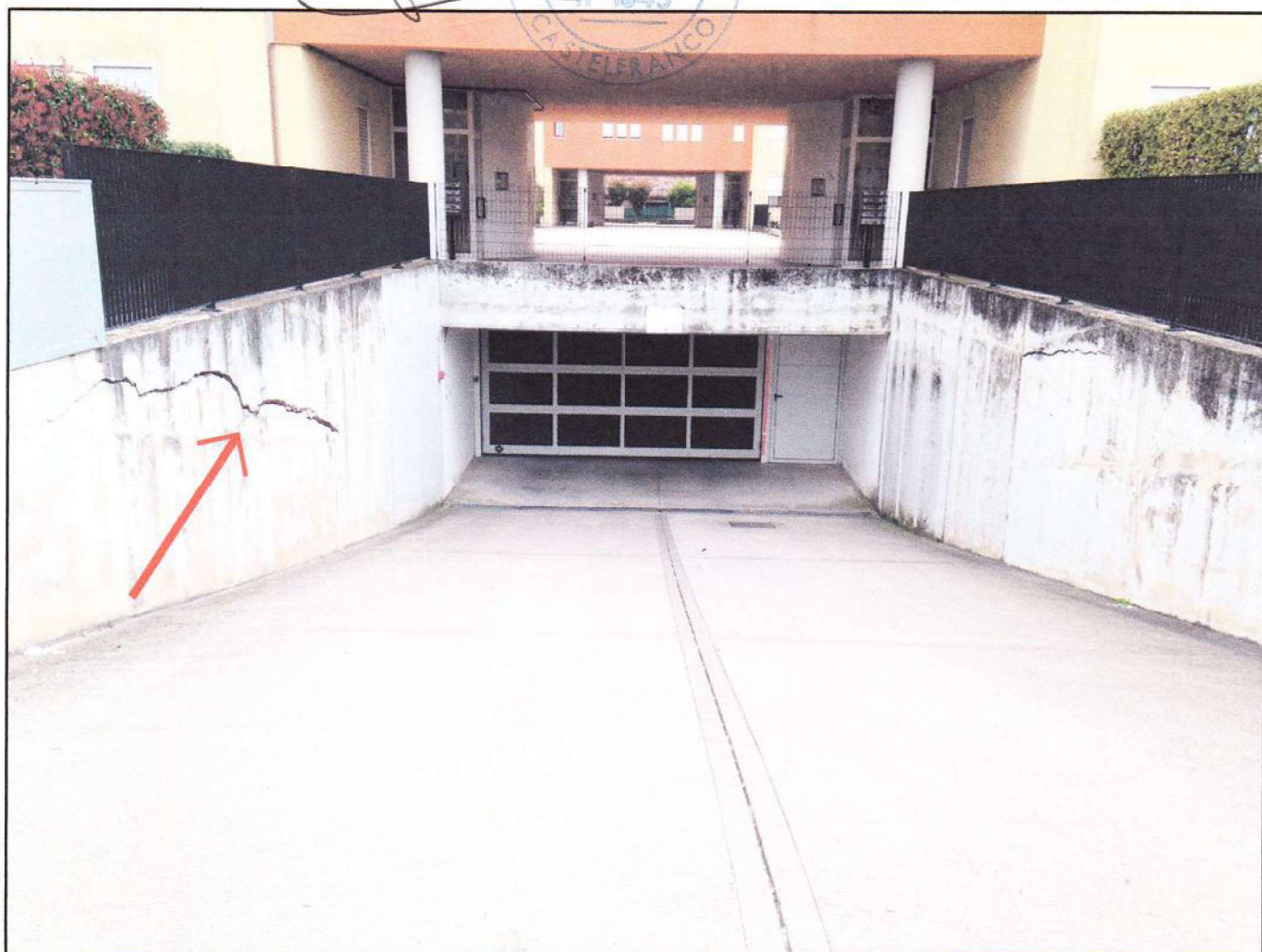
CONO VISUALE N. 04